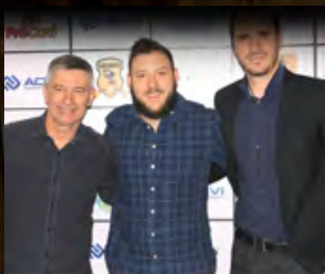
Santar 40 anos