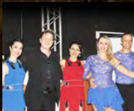
Santar 40 anos