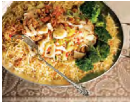
Arroz de Bacalhau