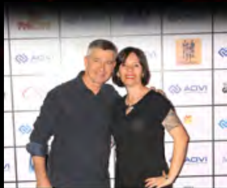
Santar 40 anos