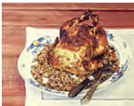
Frango à Moda Espanhola

A ceia de Natal é, com certeza, um dos momentos mais esperados do Natal para muitas pessoas - além da troca de presentes, claro. O grande problema é inovar para que a família não se canse de comer a mesma comida todo ano. Pensando nisso, selecionamos 50 dicas para que ninguém fique sem opção. Tem carnes para todos os gostos, pratos para vegetarianos , acompanhamentos e sobremesas deliciosas! Confira: