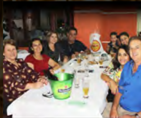
Santar 40 anos