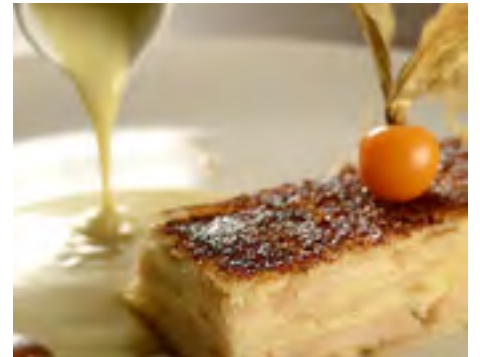
Rabanada de Pera