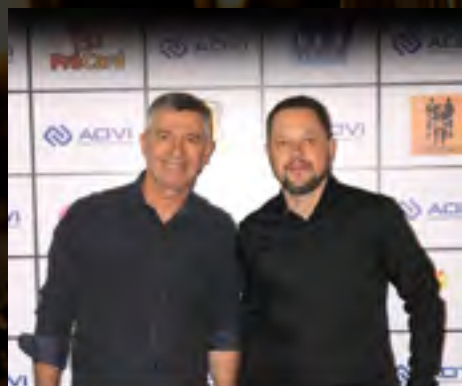
Santar 40 anos