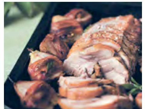
Lombo de Porco Recheado com Pera e Gorgonzola