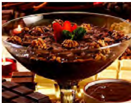
Estrogonofe de Chocolate e Nozes com Cachaça