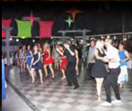
Santar 40 anos