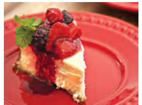
Cheesecake com Calda de Frutas Vermelhas