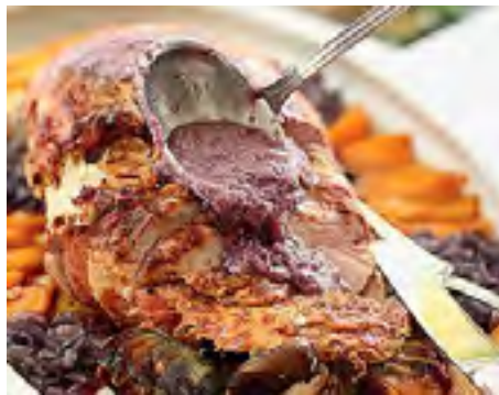
Pernil com Molho de Azeitonas Pretas e Cebolas