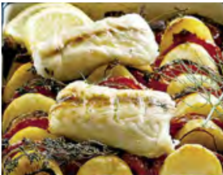
Peixe Assado com Batatas ao Alho