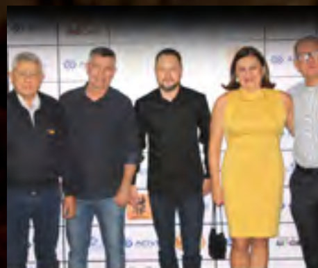
Santar 40 anos