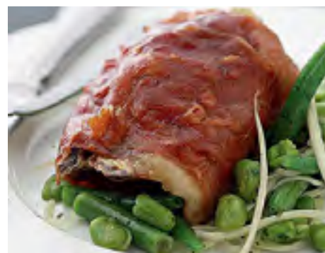
Sobrecoxa de Frango com Presunto cru