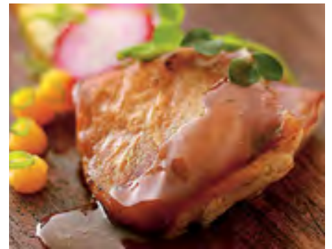
Leitão de Leite, Acerola, rabanete e diferentes Cebolas