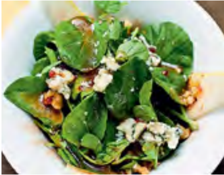
Salada de Agrião, Peras e Vinagrete de Geleia de Framboesa