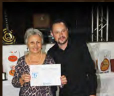
Santar 40 anos