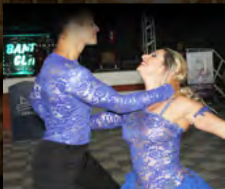
Santar 40 anos