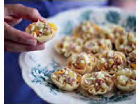
Salpicão de Pernil