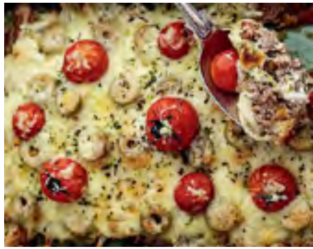
Carne Moída de Forno