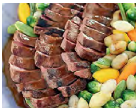
Lombinho de Cordeiro ao Molho de Vinho Tinto e Minilegumes Sauté