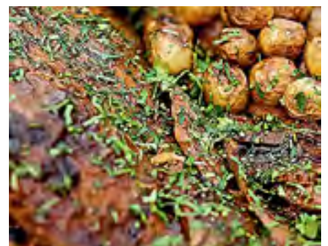
Pernil de Cordeiro e Batatas Assadas com Alecrim