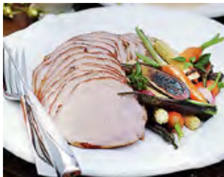
Lombo ao Molho Cítrico de Capim-Santo e Gengibre com Cuscuz Marroquino e Minilegumes