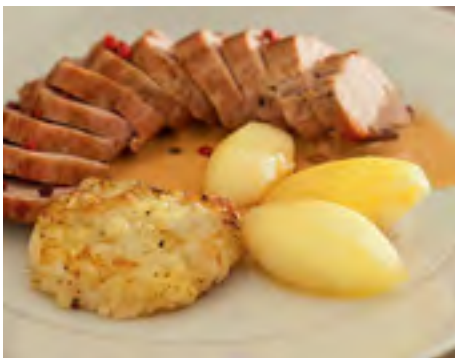
Filé de Leitão com Batata Dourada, Maçã Caramelada e Pimenta-Rosa