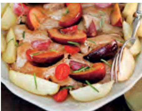
Pernil Assado na Cachaça com Alecrim e Batatas Rústicas