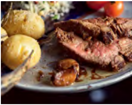
Rosbife de Filé-Mignon