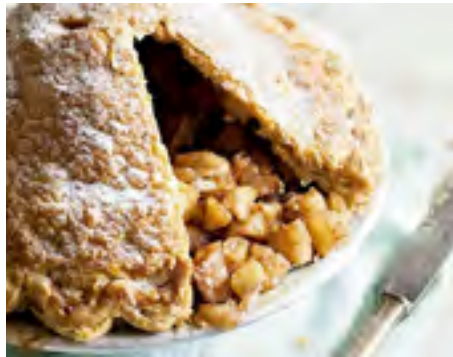
Torta de Maçã