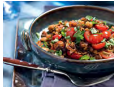
Arroz com Lentilha, Cebola Caramelizada e Torresmo Crocante