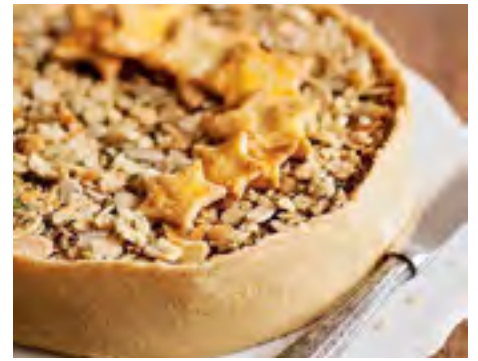
Torta Aberta de Bacalhau com Farofa Crocante e Pão de Amêndoas